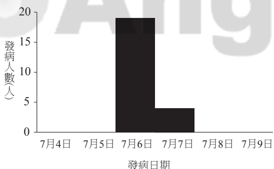
圖二、106年桃園A科技公司食品中毒調查對象之個案發病日分布圖

病潛伏期範圍2-19小時，中位數9小時。依據病例發病日，繪製流行曲線圖如圖二，呈現單一波峰形狀，故可推論本次群聚事件為單點來源、共同感染之食品中毒案件。