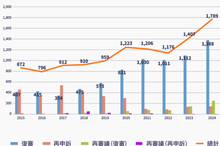
圖1 各類保障事件統計(案件數)

圖1及圖2分別提供我國近十年保障事件提起類型的相關資訊，過去十年共有11,260件保障事件之收案件數。 [4] 從圖1得知，自2020年起，每年都超過1,000件，到了2024年，案件數甚至達到2015-2016年的2倍以上。可知，我國保障事件有逐年成長的趨勢。