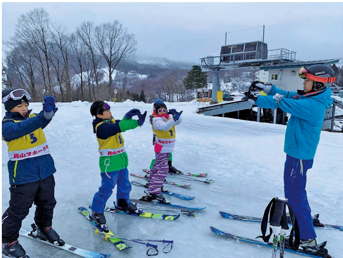
圖 8 滑雪前熱身運動

我們 6 天的交流活動包括姊妹校西川國小締結儀式、參訪和入班學習、蕎麥麵、和果子和茶道等文化體驗活動，更安排許多雪上活動。因為我們多數臺灣的孩子不曾見過雪，眼前都是沒有機會看到的景象，所以我們都非常高興接觸到雪地行進與滑雪這個特別的體驗。但是西川町的朋友們卻一直向我們抱歉，雪況不好，更是讓我們嚮往與羨慕日本的孩子。在學習滑雪運動時可以看出小朋友的潛力無窮，一下子就能站上雪板上滑行，老師和隨行家長們也努力地學習。雖然語言不通，但是西川町的教練們很有經驗，也非常用心，手把手地，甚至跪在雪地上引導我們，讓我們都體會到滑雪的樂趣。