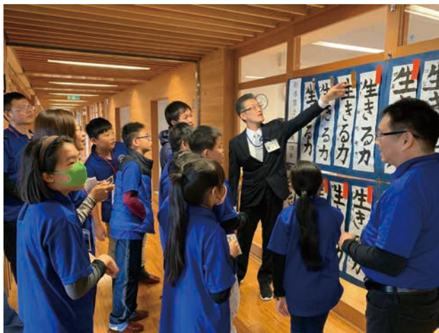
圖 3 西川國小校園參觀

這次交流的對象和地點為日本山形縣西川町。西川町裡面有一座日本百大名山，非常著名的月山（ gasan ），平均年下雪量高達 100 公尺，也因此，月山滑雪場要到每年的 4 月 10 日左右，當其他滑雪場都結束時才開放，但是可以一直滑到 7 月底左右才結束，非常特別。當交流團隊到達西川町，觀察到小朋友們看到雪時驚奇的神情和歡喜的聲音，我們就知道這次的交流會很成功。第二天我們就直接進到西川國小和日本的老師與同學共同學習。