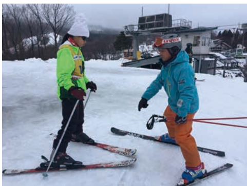
圖 9 西川町町民細心的滑雪指導