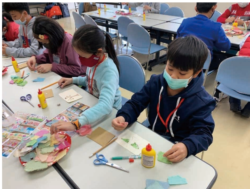
圖 21 色彩柔和繽紛的 和紙創作