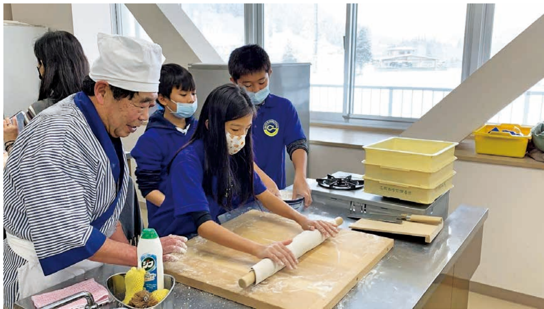
圖 14 西川町蕎麥麵製作文化體驗

這次的活動除了締結姊妹校和學習滑雪運動之外，活動筋骨後還有豐富蕎麥麵製作、和果子製作、茶道以及日本和紙創作的文化體驗活動，其中茶道體驗的佐藤正子老師的先生也是日本俳句詩人，在大家面前吟詠親手寫的俳句後送給幾位老師，頓時讓現場充滿了非常文學典雅的氛圍。