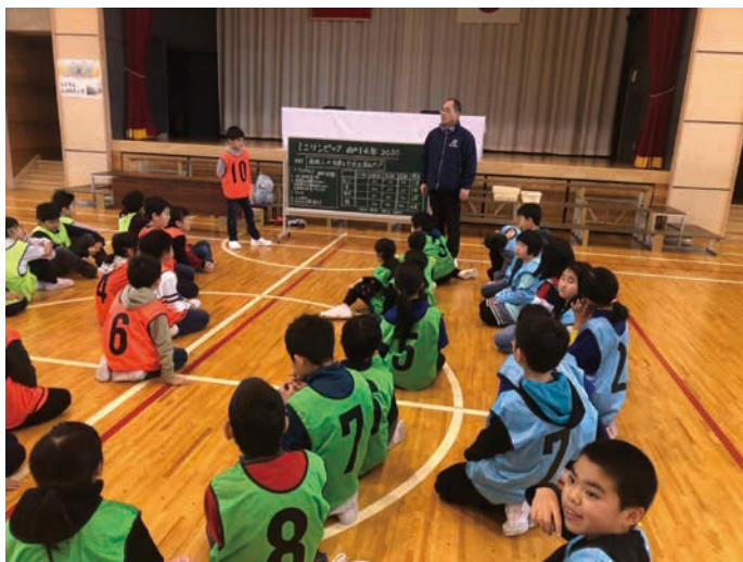
圖 4 體育課入班體驗：迷你奧運會