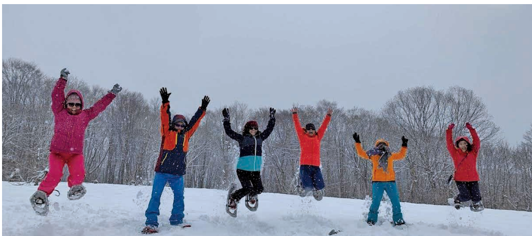
圖 13 穿大雪鞋越野活動