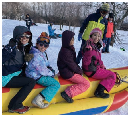
圖 12 雪上香蕉船