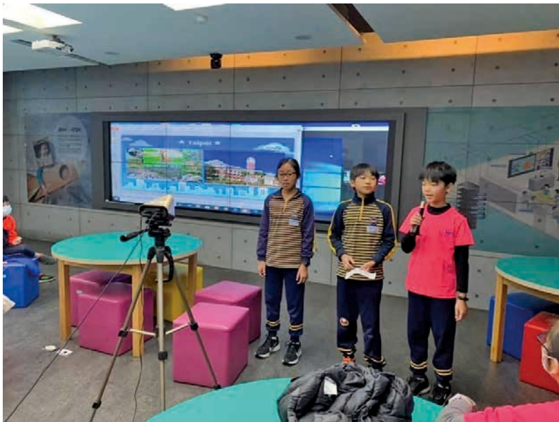
圖 22 南湖國小同學透過視訊介紹臺灣

因為日本的過年是西曆的1月1日，他們都有過年寫書法的習俗，所以西川國小的同學寫下他們的祝福裝箱寄給我們。我們也請同學準備禮物和小紀念品寄過去祝福他們，交換彼此的學習成果。整體來說，一趟運動觀光的國際交流活動可以學會一項運動技能，體驗不同的文化和學習環境，是我們師生最大的收穫。期望未來解封以後能繼續推動這項有意義的交流活動。