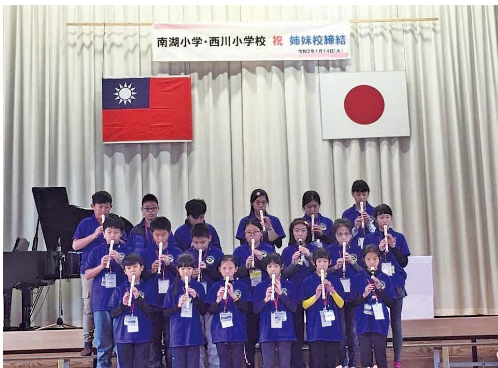
圖 5 締結儀式中南湖國小的直笛演奏