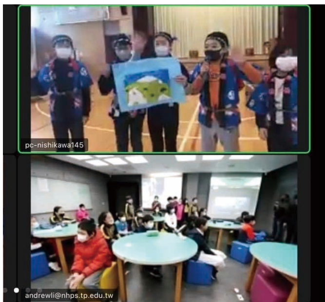
圖 23-2 南湖國小同學透過視訊介紹臺灣