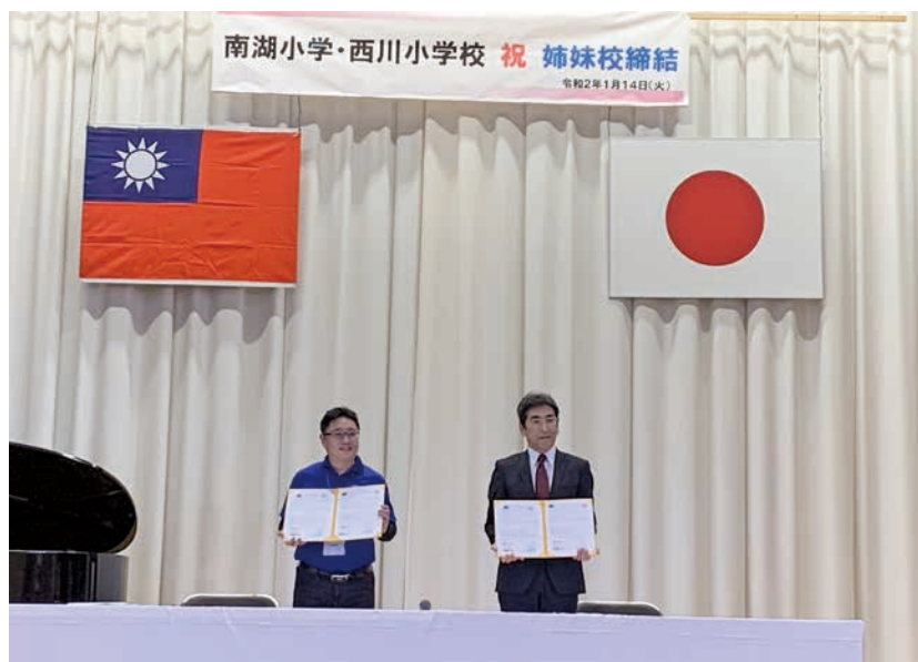
圖 6 姊妹校締結儀式