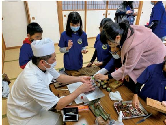
圖 15 西川町日本和果子製作體驗