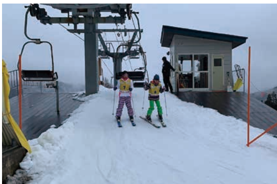
圖 10 教練准許搭纜車就是會滑的肯定