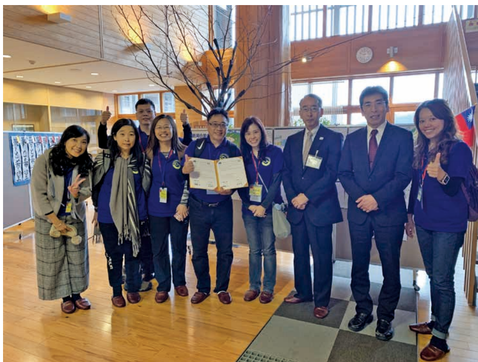
圖 7 締結儀式後在象徵日本小學建築中心的大黑柱前合影