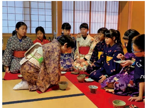
圖 16 西川町著和服茶道體驗