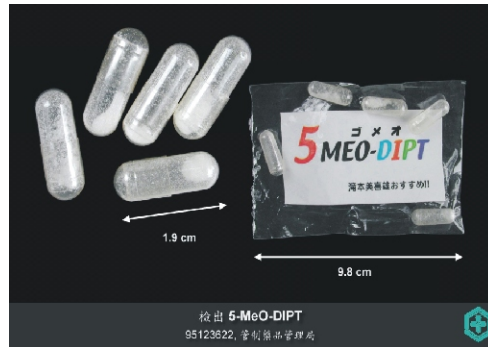
▲本局最近檢出之5-MeO-DIPT檢體照片