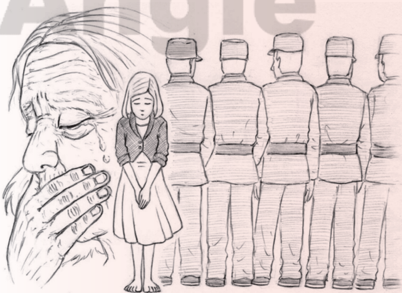
不堪回首，本圖傳達慰安婦一天至少要被侵犯八九次以上的殘酷經驗。