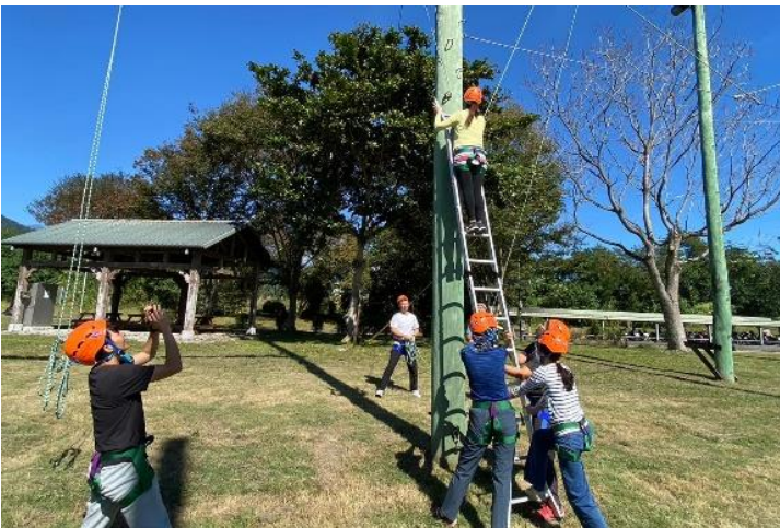
規劃自我成長研習課程-2