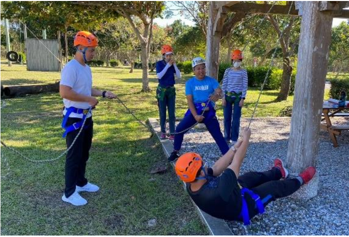
規劃自我成長研習課程-1