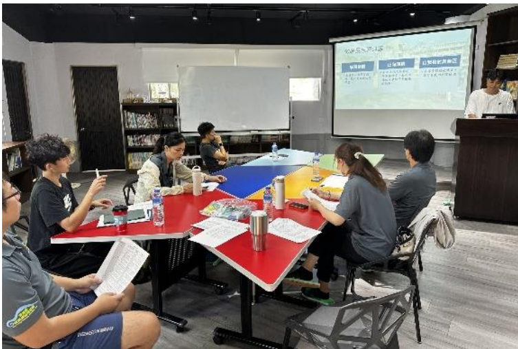
健體領召研習及到校說議課-2