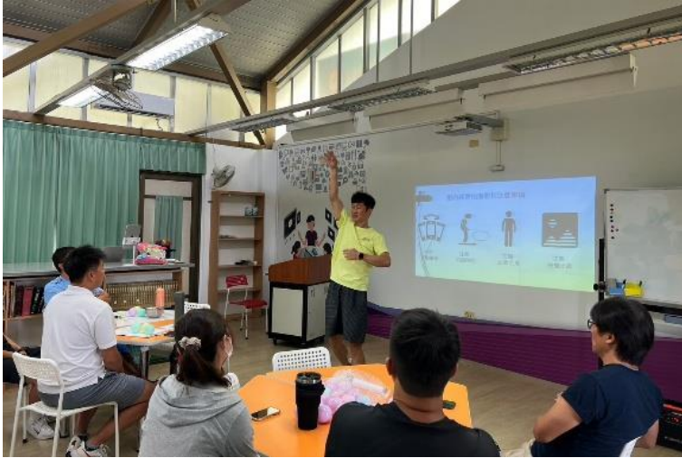
健體領召研習及到校說議課-1