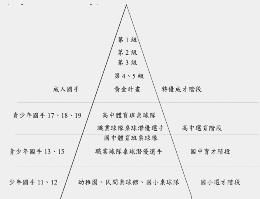
圖 2 臺灣一貫化桌球選手培育體系

以上國內一時之選世界排名選手，經年累月南征北討參加 ITTF 巡迴賽累積積分，除了政府行政單位支持，國內企業如合庫、國泰及一銀，出錢出力全方位照顧選手，提供營養金及各類獎學金，退役後安排正式職員就業，選手無後顧之憂，全力拚搏發光發熱。臺灣競技桌球蓬勃發展，關鍵背後重要推手，